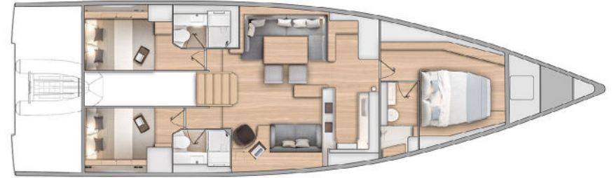
LOWER DECK - 3 CABINS / 3 HEADS + SAIL LOCKER PONT INFERIEUR - 3 CABINES / 3 SALLES D'EAU + SOUTE A VOILES