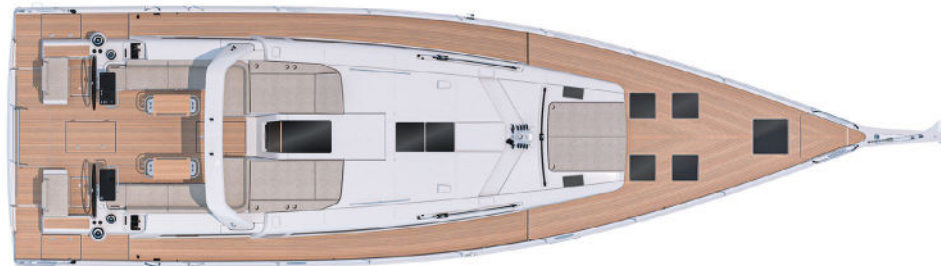
MAIN DECK PONT PRINCIPAL