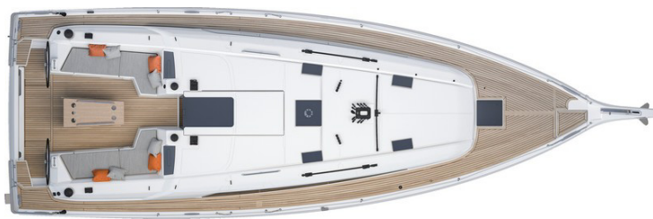
Version 2 camarotes 1 aseo