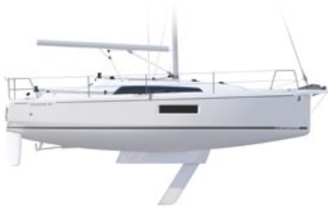
PROFILE Swing keel version - Tirant d'eau dériveur lesté