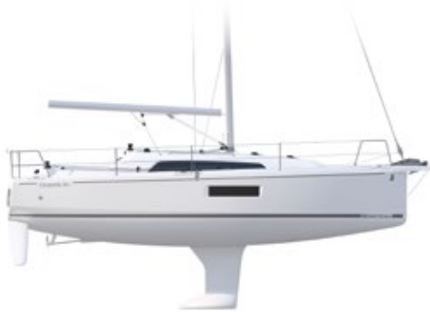
PROFILE Standard draft - Tirant d'eau standard