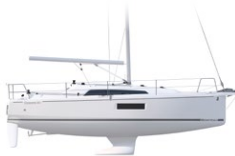
PROFILE Shallow draft - Tirant d'eau court