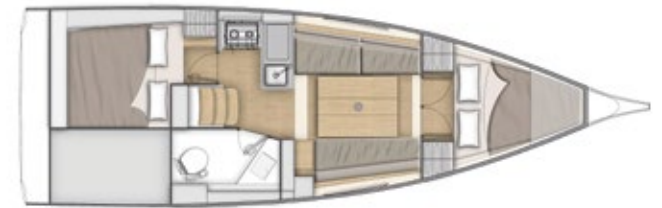
LOWER DECK 2 cabins + 1 head - 2 cabines + 1 salle d'eau