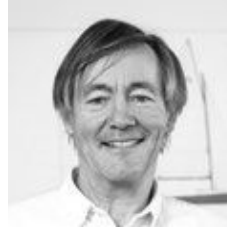
PASCAL CONQ Architect

“ Certains détails sont vraiment étonnants sur l’Oceanis 30.1, surtout si on pense à sa taille. La plate-forme arrière est grande et confortable. La forme du pont de chaque côté de la descente a été inclinée pour une meilleure utilisation des panneaux de pont ouvrants, tout en donnant un look élégant. Les espaces intérieurs sont remarquablement volumineux et hauts pour un 30 pieds, et lorsque vous entrez dans la salle d’eau, vous avez l’impression d’être sur un voilier beaucoup plus grand. L’éclairage indirect, avec le ruban lumineux de chaque côté du carré, crée une atmosphère élégante et accueillante à l’intérieur. ”