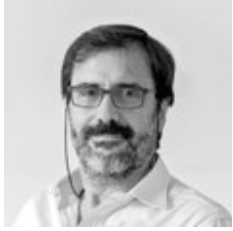
MASSIMO GINO Nauta Design

“Some details are really amazing in this project, especially if we think of her size. The aft platform is very comfortable and big. The shape of the deck on either side of the companionway has been angled for better use of the deck hatches, but it also looks very elegant. The interior spaces are strikingly large and high for a 30’, and when you enter the shower room you feel like you are on a much bigger yacht. The indirect lighting, with rope lights on either side creates a stylish yet welcoming atmosphere inside.”